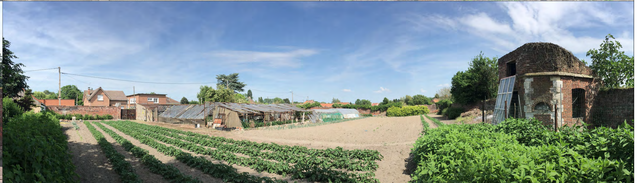
Photo Environnement Proche - Vue 4 - Existant (serre à démolir et pigeonnier à restaurer)