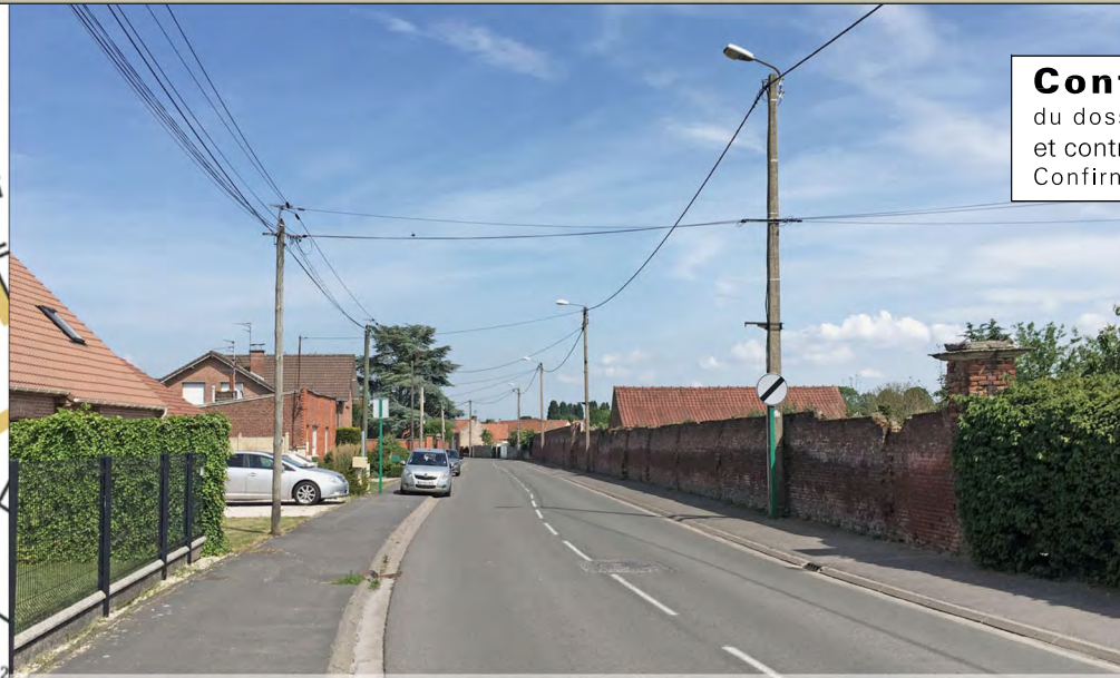
Photo Paysage Lointain - Vue 1 - Existant