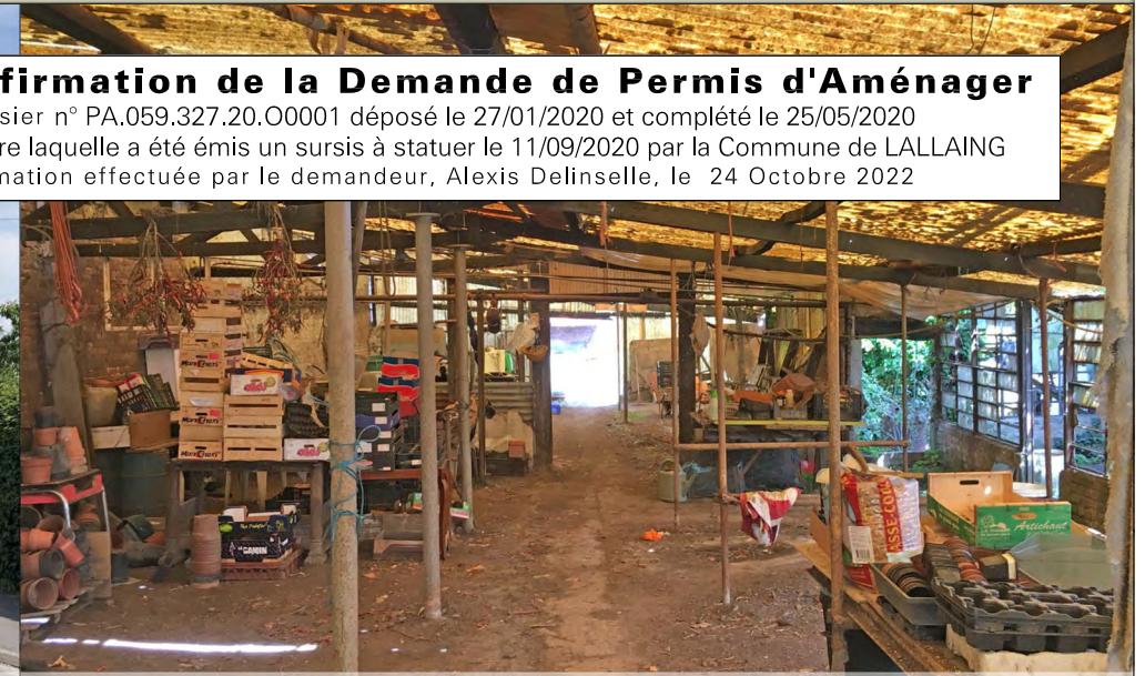
Photo Démolition - Vue 6 - Existant